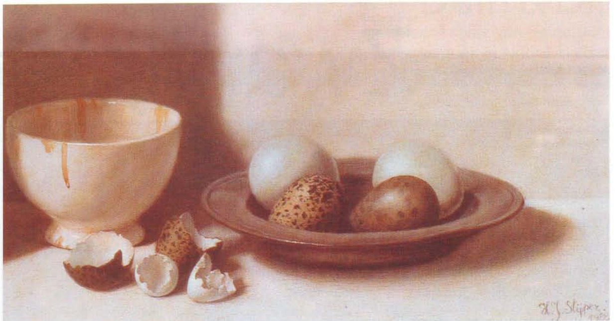
● Stilleven met eieren, H.J. Slijper

roofvogels, het oog in oog staan met hen, boeide Henk. Hij heeft heel wat prachtige portretten van 'zijn' vogels geschilderd.